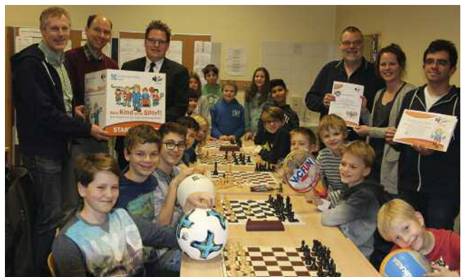
Schachverein Bad Schwartau