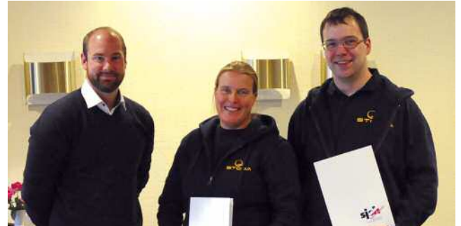
SG Stormarn Barsbüttel