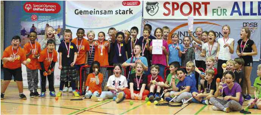
Die Kinder hatten richtig Spaß beim Floorball-Camp.

Vom 5. bis 9. Dezember 2017 hatten Special Olympics Deutschland und Schleswig-Holstein, der Floorballverband Deutschland und Schleswig-Holstein, der Kreissportverband Stormarn und der Hoisbütteler SV zu einem Unified/Inklusiven Floorball Camp für alle in die moderne Dreifeldhalle in der Gemeinde Ammersbek eingeladen.