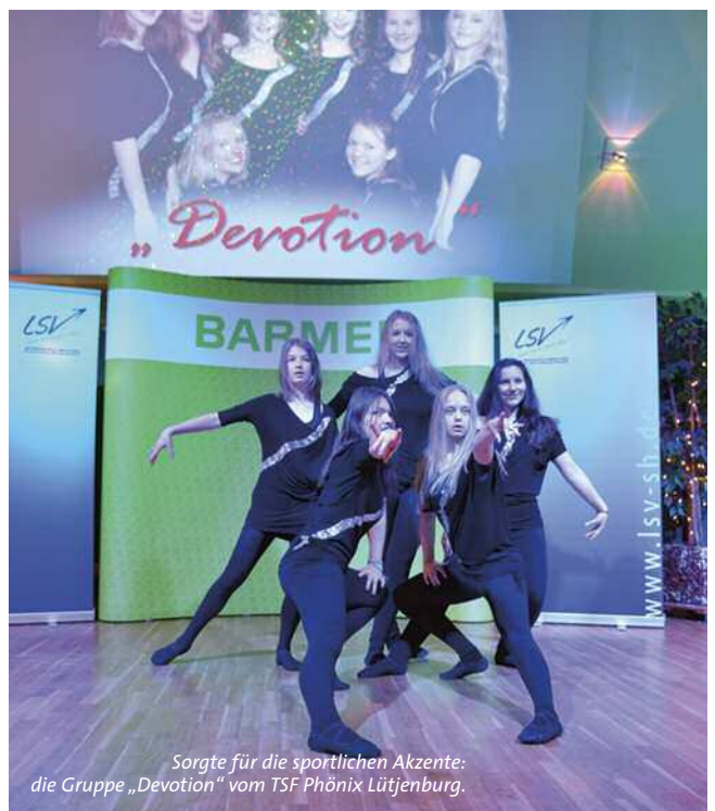
Sorgte für die sportlichen Akzente: die Gruppe „Devotion“ vom TSV Phönix Lütjenburg.