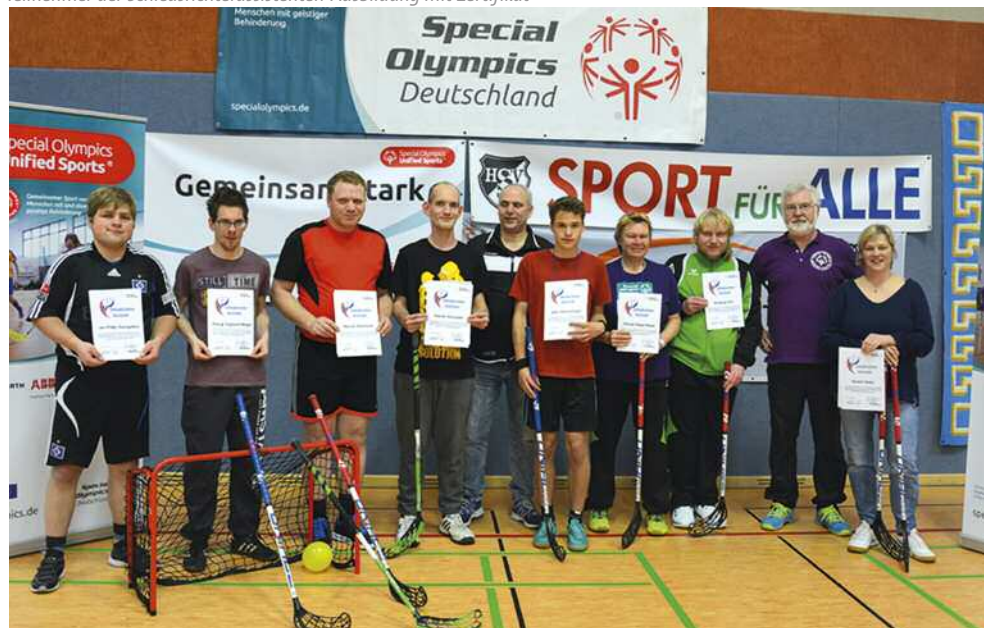
Teilnehmer der Schiedsrichterassistenten-Ausbildung mit Zertifikat