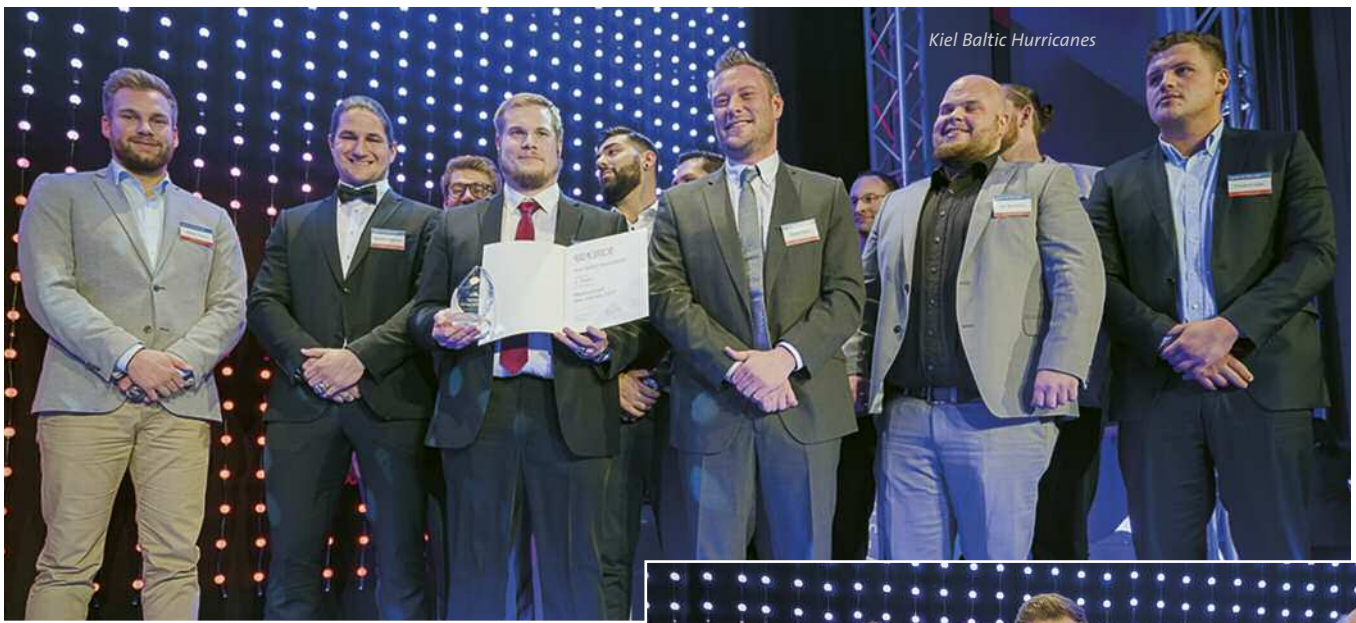
Kiel Baltic Hurricanes