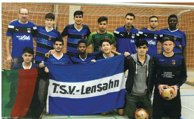
Die zweite A-Jugend-Mannschaft des TSV Lensahn setzt sich überwiegend aus geflüchteten Jugendlichen zusammen. Für sein Engagement wurde der Verein mit einer Fördersumme von 1.500 Euro bedacht.