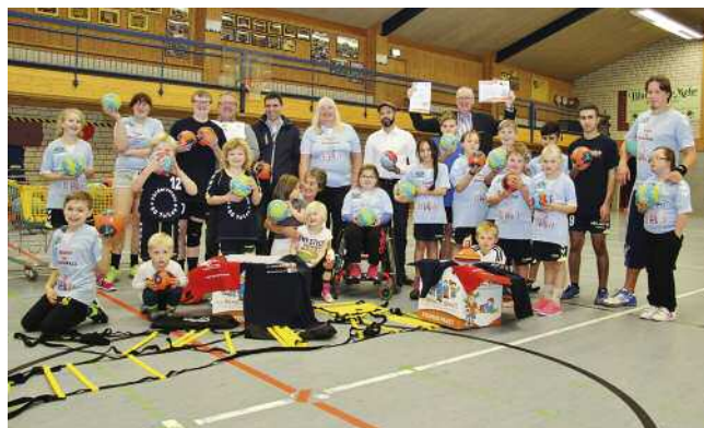
Leezener SC und SV Todesfelde