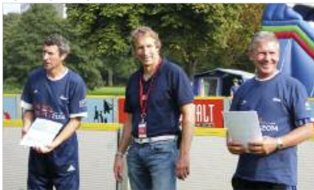
Siegerehrung beim Tag des Sports 2014.