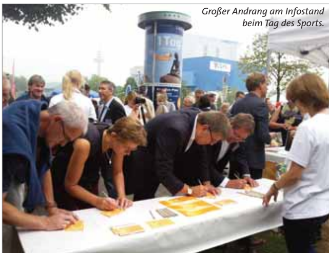
Großer Andrang am Infostand beim Tag des Sports.