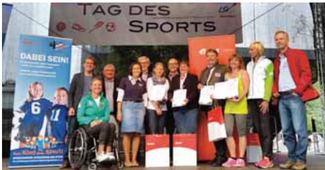
Ernennung der vier Botschafter gegen Kinderarmut.

Dank der großartigen Unterstützung der Partner und Förderer konnte die Sportjugend beim diesjährigen Tag des Sports erneut im Rahmen verschiedener Aktionen auf ihre Initiative „Kein Kind ohne Sport!“ aufmerksam machen.